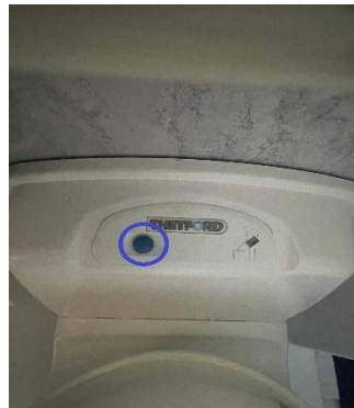
(afb. 27) spoelen wc