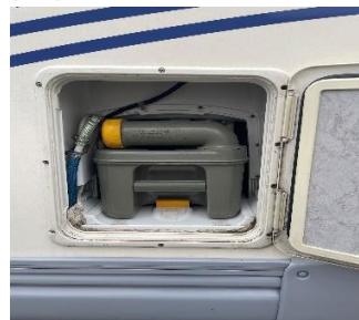
(afb. 6) Vulpunt schoonwater. (afb. 7) Blauwe kraan onder eerste bank (afb. 8) WC ruimte