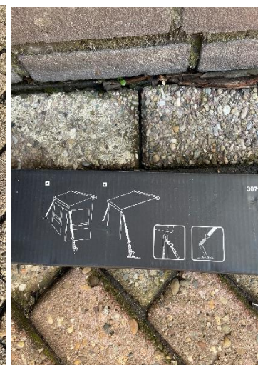
(afb. 13c) stormbanden set