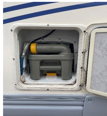
(afb. 8) wc cassette