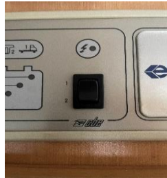
(afb. 16a) schakelaar accu's