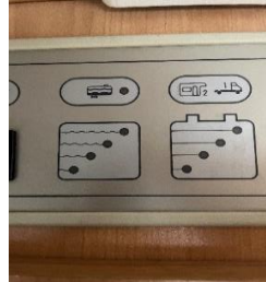
(afb. 16b) RE. Status accu's