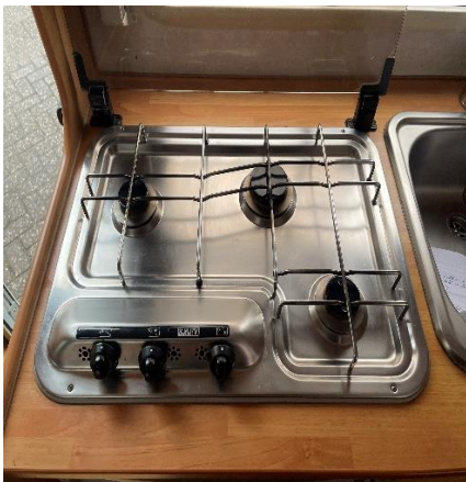
(afb. 23) gasfornuis

Om het driepits gasfornuis te gebruiken dient u rechts aan de buitenzijde van de camper het eerste luik met de sleutel te openen, gasfles te openen, naar rechtsdraaien is open, vanaf boven tegen de klok in is open. (afb.21) Bij het gasfornuis de betreffende knop in te drukken en met een aansteker of lucifer de pit aan te steken, knop nog even vasthouden en naar de gewenste vlam grote te draaien. (afb. 23)