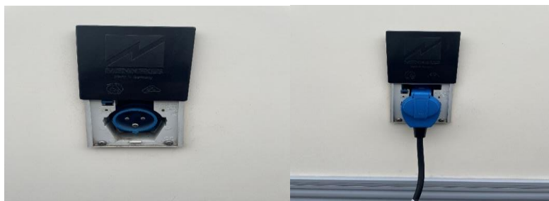
(afb. 10) netstroom aansluiting

Als u op uw bestemming netstroom aangeboden heeft gekregen kunt u dit aansluiten op de camper. Er ligt een kabel van 30 meter en een verloopkabeltje links achter in de berging. Deze kabel kunt u aansluiten op de camper. Halverwege de camper aan de linkerkant zit een zwart dekseltje, schuif deze omhoog, zodat u de kabel kan aansluiten. (afb. 10)