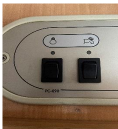
(afb. 15) Stroom aan/uit