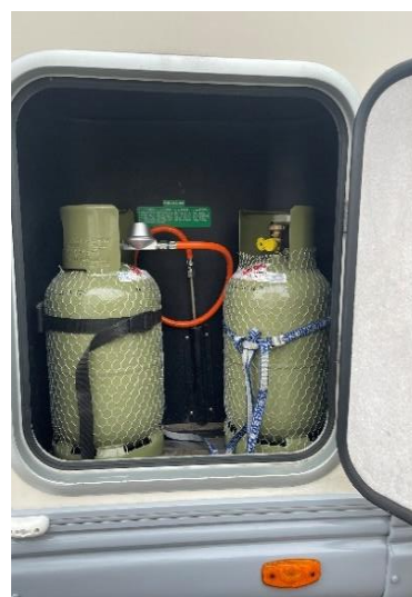
(afb. 21) gasflessen