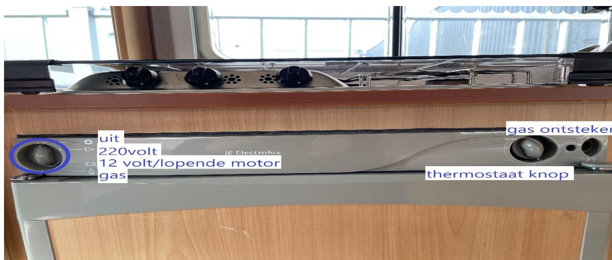
(afb. 18) koelkast bediening

Koelkast (afb. 18) werkt op gas, 12volt (accu van de camper) of 220 volt (netspanning van uw bestemming). Als u onderweg bent dan zet u de linker draaiknop (afb. 19) van de koelkast op het accu symbol. Koelkast werkt nu op 12 volt, koelt niet super, maar het koelt. Heeft u netspanning van uw bestemming, dan draait u de linker draaiknop naar het stekker symbool, dit is de beste optie, dan koelt de koelkast het best. Wilt u de koelkast op gas gebruiken, als u bijvoorbeeld geen netspanning heeft en de accu's wilt sparen. Rechts aan de buitenzijde van de camper, het eerste luik, hier staan de gasflessen. Luik openen met de sleutel, gasfles geheel opendraaien, (afb. 21) als je ervoor staat naar rechts draaien is open, van bovenaf gezien tegen de klok in is open! Linker draaiknop op koelkast op vlam symbool draaien, rechter draaiknop (afb. 20) indrukken en ingedrukt houden. Dit is de ontsteker van het gas die je hoort tikken, stopt het getik, dan brandt de koelkast op gas. Met deze zelfde draaiknop kunt u ook de koelkast harder en zachter laten koelen.