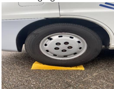
(afb. 9) oprij bokken

Als u aankomt op uw bestemming, camping of camperplaats zoek dan altijd een plek met een stevige ondergrond, zodat u niet verzakt raakt, waardoor u na u verblijf niet/moeilijk de bestemming kan verlaten. Als u wenst dat de camper mooi horizontaal op zijn plek staat, rijd dan de voorwielen op de oprijbokken, (afb. 9) deze liggen linksachter in de berging. Kijk of de camper mooi vlak staat en trek de handrem aan, leg desnoods voor de veiligheid nog een blokje hout achter de achterwielen. Deze blokjes liggen ook linksachter in de berging.