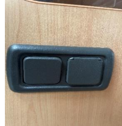
(afb. 17) 220 volt aansluiting Bij entree