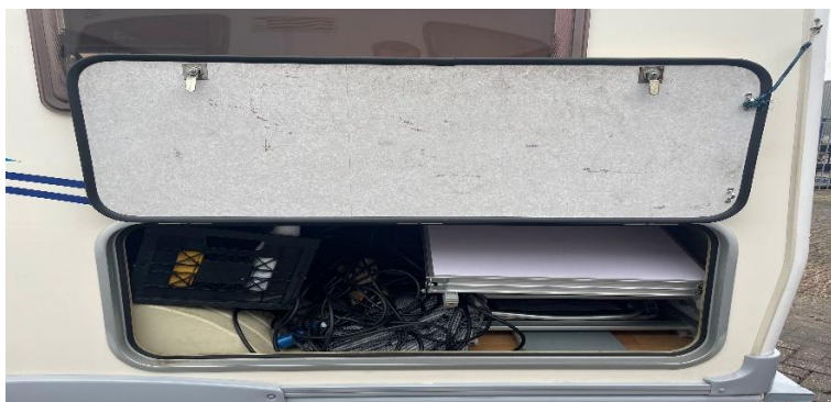
(afb. 5) Luik berging, te openen met vierkante sleutel aan contactsleutel bos