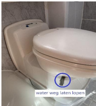
(afb. 26) openen wc

Als u de wc gebruikt, dient u de hendel rechts naast/onder de pot te bedienen, (afb. 26) hiermee opent u de schuif in de wc cassette onder de wc. Doorspoelen doet u door op de blauwe knop op het bedieningspaneel van de wc te drukken. (afb. 27) Als u klaar bent bedient u opnieuw de hendel naast/onder de pot, om de afsluiter weer dicht te doen. Voor deze wc dient u speciaal wc papier te gebruiken, dit is in de toiletruimte aanwezig. Als de wc vol is moet deze geleegd worden op speciaal daarvoor ingerichte plaatsen. Aan de buitenzijde van de camper, rechts het laatste luik, u opent deze met de sleutel, druk de gele hendel omhoog en trek de gehele wc cassette eruit, nu kan deze geleegd en gereinigd worden. (afb. 8) Daarna vult u weer blauwe vloeistof bij, door de gele grote dop, dit is tevens uw maatbeker voor de hoeveelheid die erin moet, en vult u nog een liter water bij in de wc cassette. Blauwe vloeistof (aqua kem), tuinslang en gieter bevinden zich in de berging linksachter. Voor het doorspoelen van de wc wordt water gebruikt uit de schoonwatertank, zorg dus altijd dat voldoende water aanwezig is.