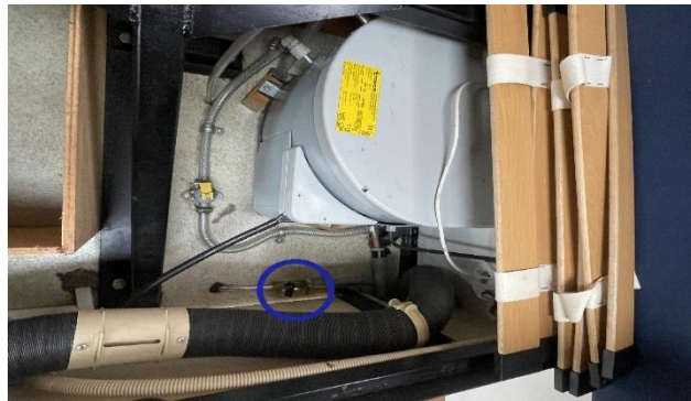
(afb. 8) Zwart kraan/hendeltje onder tweede bank om schoonwatertank leeg te laten lopen