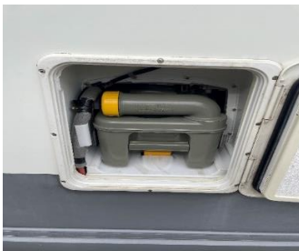
(afb. 9) WC cassette ruimte toegangsdeur te openen met sleutel aan contactsleutel bos.

Het achterste luik aan de rechterkant van de camper zit de wc cassette. (afb. 9) Deze dient voor gebruik gevuld te worden met (aqua kem) blauwe afbreek vloeistof. Open het luik met de sleutel, deze zit aan de contactsleutel. Druk het gele rechthoekige hendel omhoog en trek/schuif de wc cassette naar buiten. Draai de gele dop los (dit is tevens je maat beker), vul deze met de blauwe vloeistof en doe deze vloeistof in de wc cassette. Vul daarna nog 1 liter water in deze cassette met de gieter of tuinslang. Draai de dop er weer op en schuif de wc cassette weer in het luik zover dat de gele lip hem weer borgt. Het luik kan weer gesloten worden. Gieter en tuinslang bevinden zich links achterin de berging.