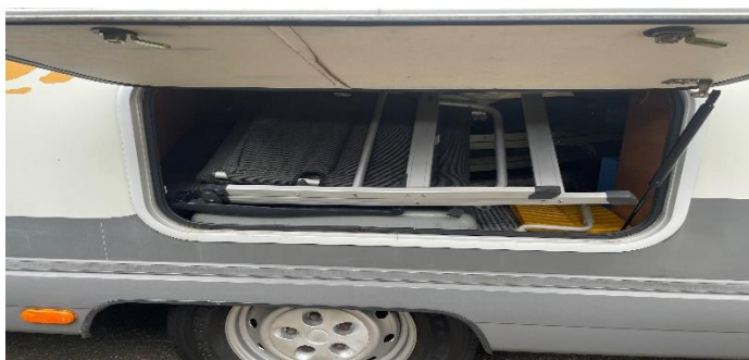
(afb. 5) Luik berging, te openen met sleutel aan contactsleutel bos

Controleer de verlichting door alle verlichting een keer te bedienen. Bij defecte verlichting, probeer eerst zelf een lampje te vervangen, diverse doosjes met lampjes en bolletjes bevinden zich linksachter in de berging. Gereedschap om evt. de verlichting te repareren bevindt zich ook linksachter in de berging. (afb. 5)