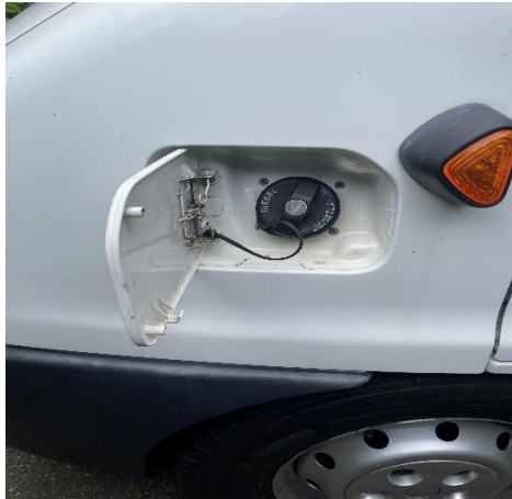
(afb. 6) tankdop, te openen met contactsleutel