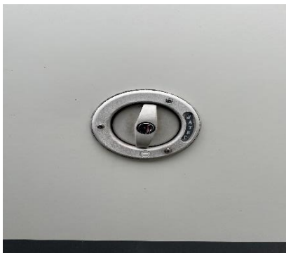
(afb. 7) Vulpunt schoonwater, te openen met sleutel aan contact sleutel bos.

Om gebruik te kunnen maken van alle waterkranen, wc, douche en warmwaterboiler, dient deze watertank gevuld te zijn met schoon water. Vuldop zit aan de linkerzijde van de camper, net achter het bestuurdersportier in de zijwand van de camper. De vuldop is te openen met een sleutel en dan losdraaien. Water vullen met een tuinslang of gieter, totdat deze overloopt, dan is de tank gevuld. Dop er weer op draaien. (afb. 7) Onder de eerste bank in de leefruimte ligt deze watertank. Als hij afgetapt dient te worden, bijvoorbeeld als het gaat vriezen, zit er onder de tweede bank, naast de warmwaterboiler een klein zwart kraantje, deze draai je open (zet hem in de richting van de leiding mee) dan staat hij open en loopt het watersysteem leeg. Draai dit kraantje dicht (hendeltje haaks op de leiding) leiding is dan dicht en het systeem kan gevuld worden. (afb. 8) De tuinslang en gieter bevindt zich links achter in de berging.